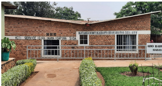
La toiture à deux pans inversés n'était pas étanche et l'eau avait causé des dégâts