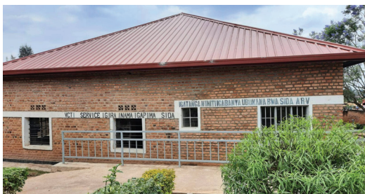
La nouvelle toiture à quatre pans assure une protection complète de la maison